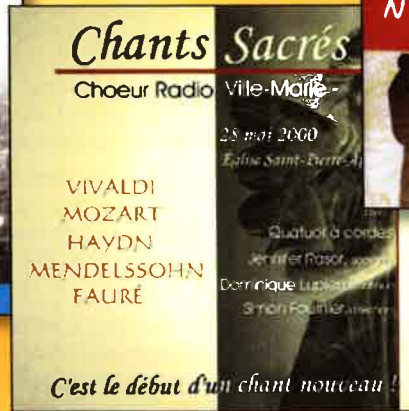
Chants sacrés Un classique!