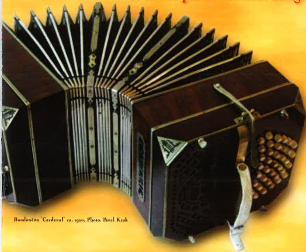
Bandoneón 'Cardenal' ca. 1920

de Martín Palmeri et autres pièces chorales d'Argentine