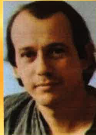
Portrait du poète cubain Silvio Rodríguez par le peintre équatorien Oswaldo Guayasamin.